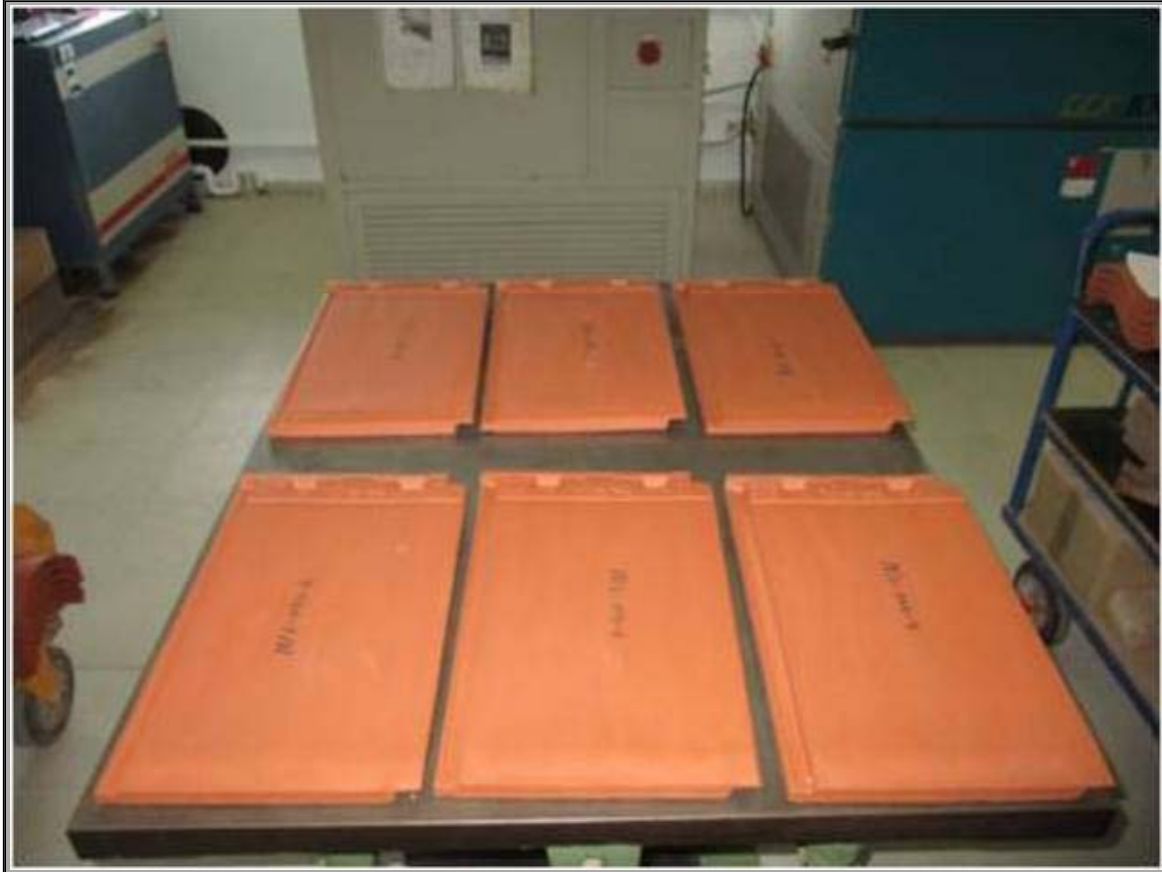
Fotografía 1: Aspecto de las tejas después de 500 ciclos de heladicidad

* Nota: Los ensayos marcados no están amparados por la acreditación de ENAC. Solamente están amparados por la acreditación los ensayos expresamente identificados como tales.